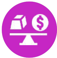
Problema e Mercado

As soluções propostas pelas equipes serão avaliadas por uma comissão julgadora com base nos seguintes critérios de avaliação: