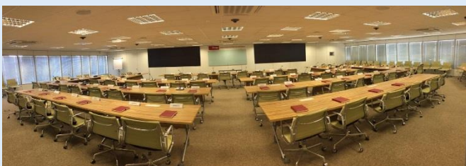
Sala de Alta Performance “Espaço Interativo Nexus”, na Enap